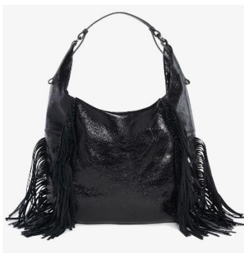
MIOW ed.1 // metallic deep tar // Foto © Marlene Mautner für INA KENT