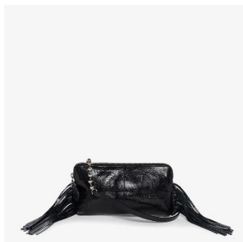
IVIET ed.5 // metallic deep tar // Foto © Marlene Mautner für INA KENT