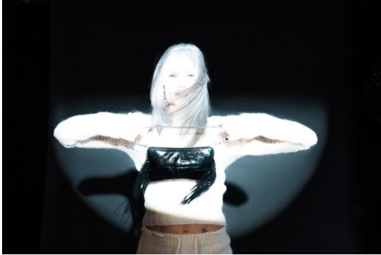
>> VIET ed.5 // metallic deep tar // EUR 215