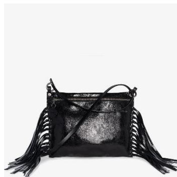
SUNLIT ed.1 // metallic deep tar