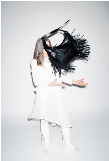
>> MIOW ed.1 // metallic deep tar // EUR 585