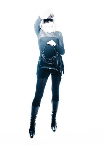
>> SUNLIT ed.1 // metallic deep tar // EUR 215 // Foto © Mala Kolumna für INA KENT