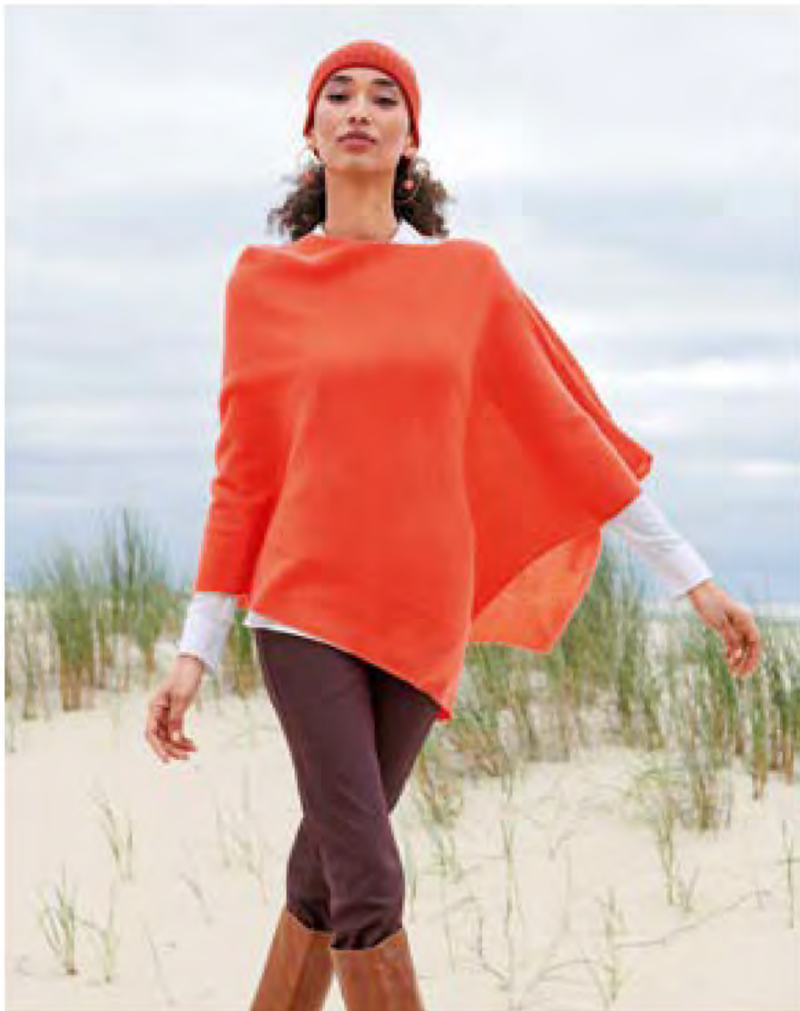
Im Trend: knallige Farben in Kombination mit Erdtönen (peterhahn.at)