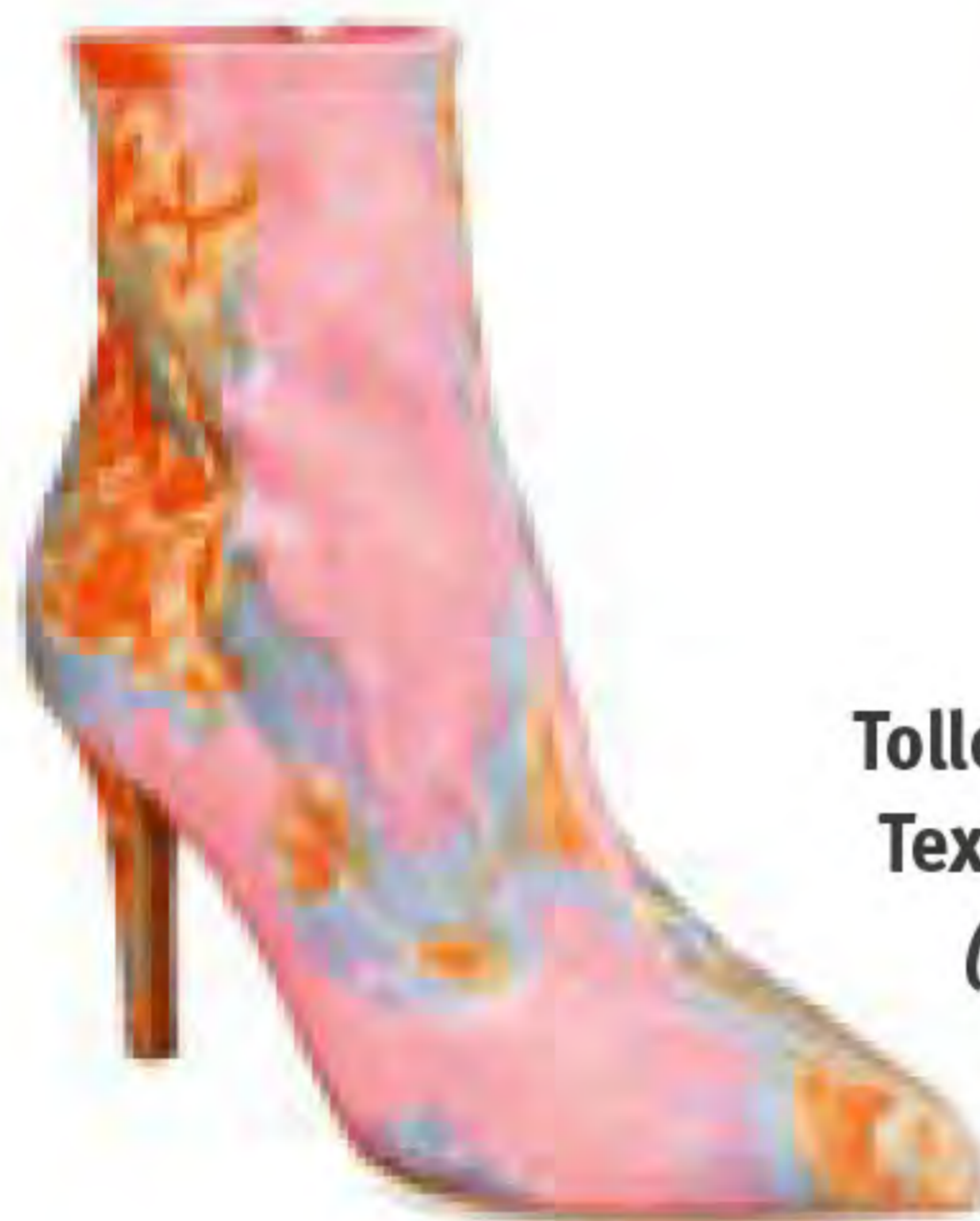
Toller Eyecatcher: Textil-Stiefelette (humanic.net)