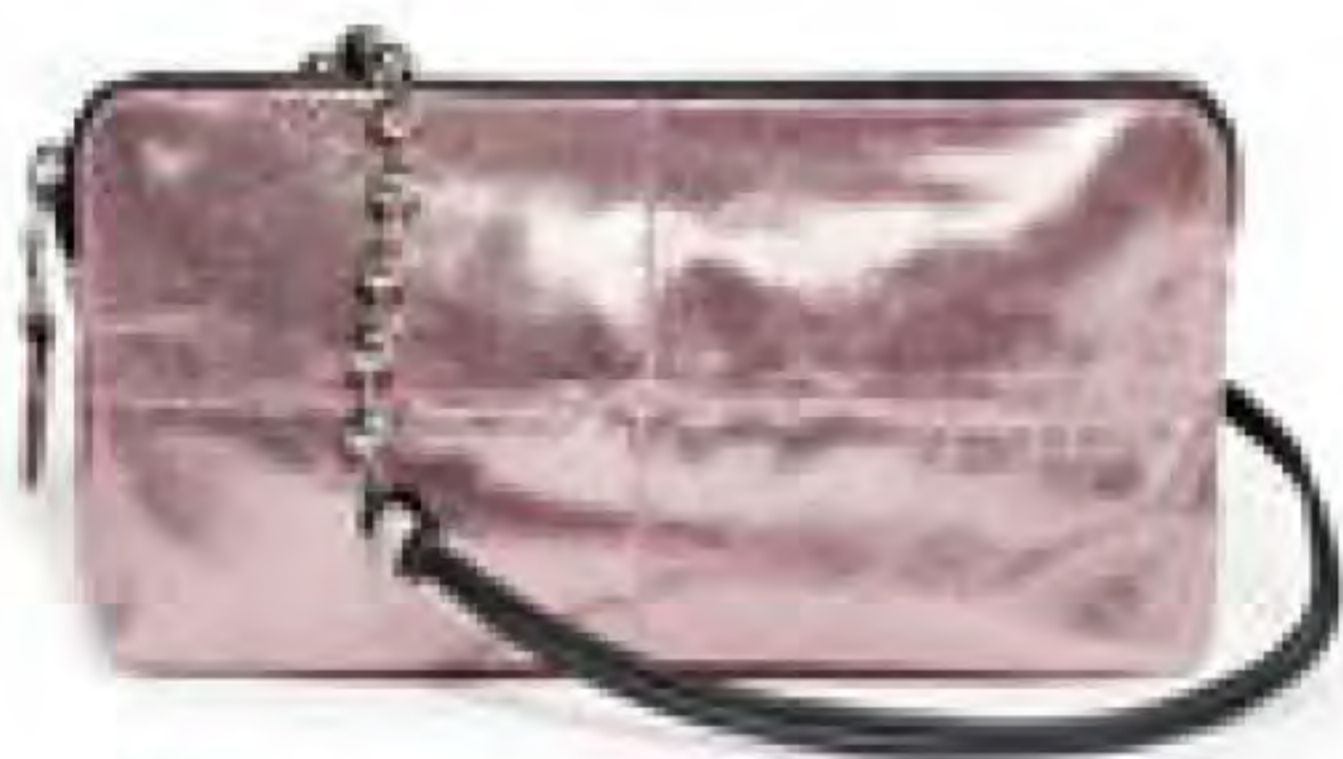
Schultertasche aus Metallic-Leder

Peach Fuzz heißt die Farbe des Jahres 2024. Macht sich sehr schön im Interiorbereich, etwas schwieriger in der Mode. Die Farbe ist immer frisch und sehr beliebt, doch macht sie leider auch blass. Viel Make-up, vor allem Rouge dazu, dann kann man diesen Frühlingston gut tragen. Im Business gerne Brauntöne dazu, in der Freizeit mit Knallfarben, wie ein starkes Lila oder ein kräftiges Pink kombinieren.